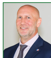
Ban lãnh đạo nhà trường